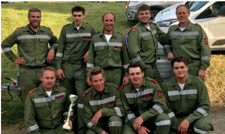
Bewerbsgruppe Karres, 2019