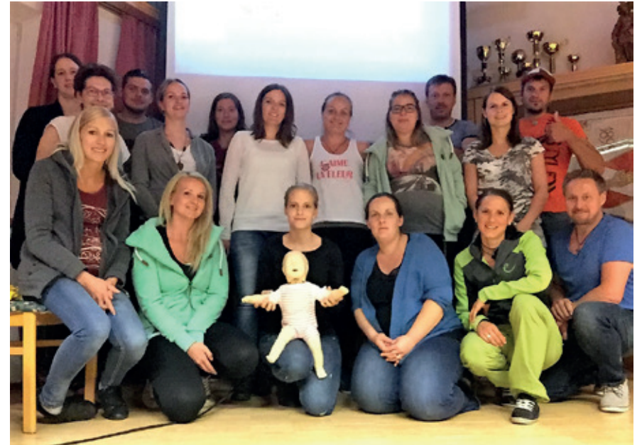
FFW Karres veranstaltet Erste-Hilfe-Kurs für Karrerinnen und Karrer, 2017