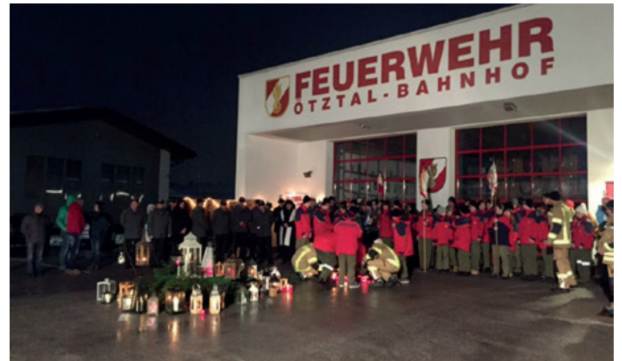
Alljährliche Friedenlichtabholung in Öztal Bahnhof