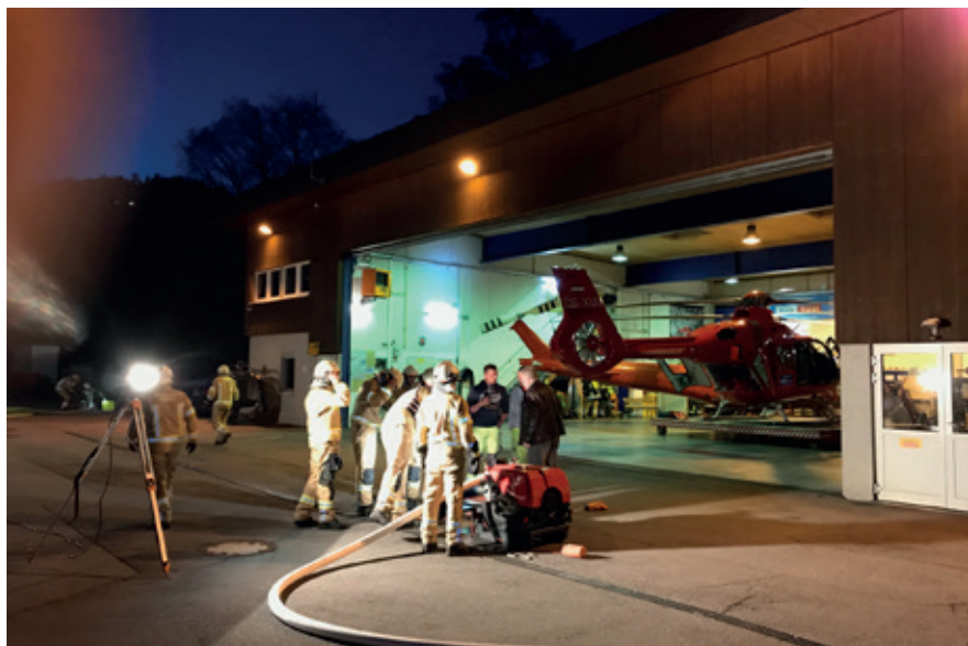
Feuerwehrrübung beim Heliport Knaus in Karres, 2019