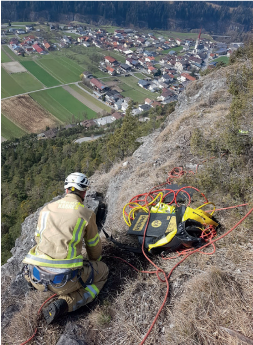
Kontrollierte Felsabsprengung im Klettergarten „Roter Wand“, 2019