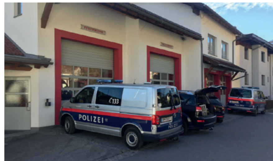
Großangelegte Suchaktion nach vermisster Person in Karres, 2018