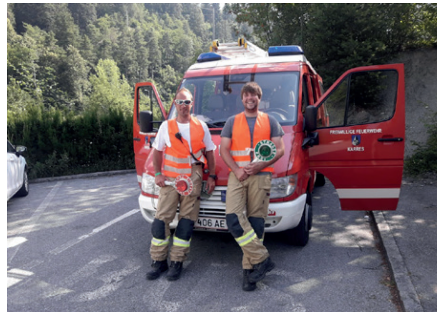
Verkehr-Regelung beim Pitztal-Marathon, 2018