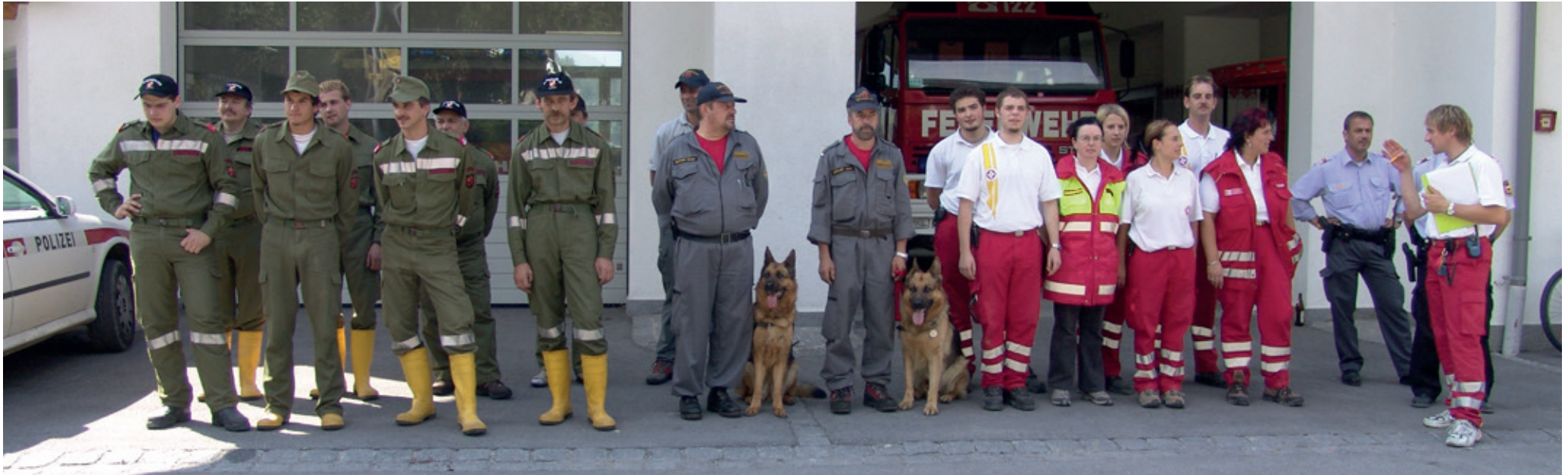
Großübung Waldsiedlung Karres, 2005