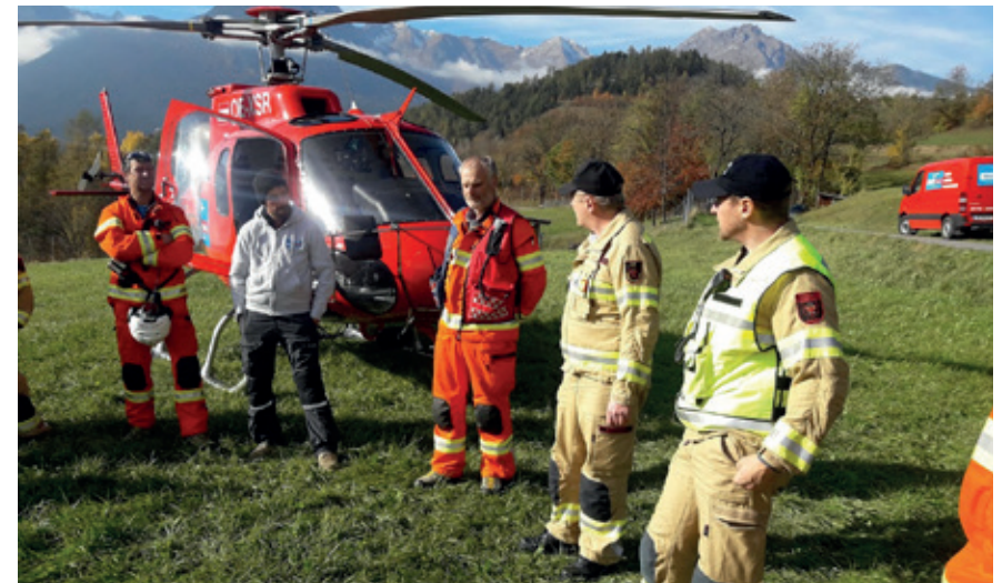
Hubschrauber-Übung mit Fa. Heli Tirol 2018, Karres