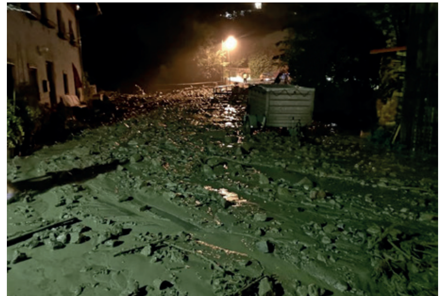
Murenabgang nach Starkregen in Karres, 2018