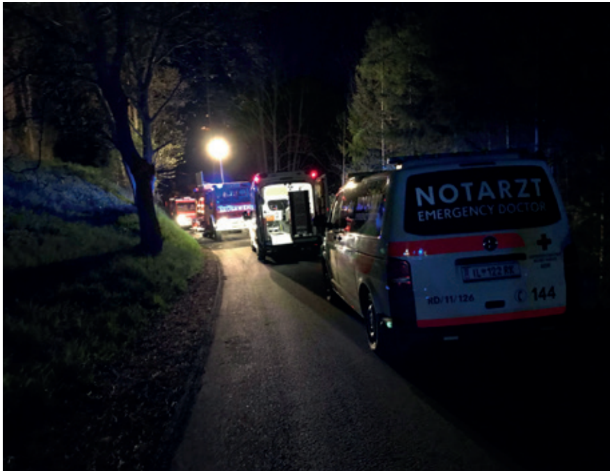
Personenrettung in Karres, 2019