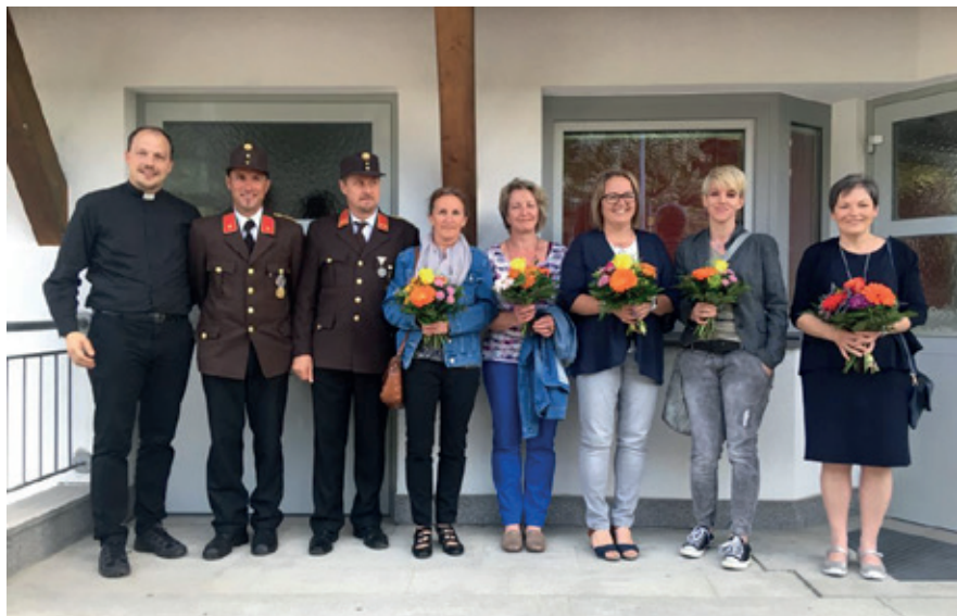
Unsere Helferinnen und Helfer im Hintergrund